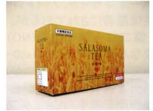
糖尿病・ダイエット向けの商品として自然免疫応用技研(株)からの技術協力を得て開発した栄養機能食品

たが、本来ハード(設備)とソフト(記録、教育など)が揃っていることが必要ですがこの精神を無視した使い方をしていることも大きな問題です。